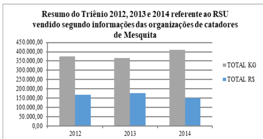
Figura 1: Quantidade de RSU recicláveis coletados e valor gerado no triênio para os catadores.

Os dados do presente trabalho demonstram que as ações das Associações e Cooperativas participantes do Programa Coleta Seletiva de Mesquita são significativas para a geração de renda dos catadores integrantes de tais organizações (Figura 1), ao passo que diminui a quantidade de resíduos destinados ao aterro sanitário. Os programas de reciclagem passam por três esferas deste contexto, educação ambiental, participação na gestão de resíduos sólidos e benefícios econômico e social às famílias. Desta forma, cooperativas de coleta e triagem de resíduos recicláveis tem papel significativo na redução de impactos ambientais, pois reduz a quantidade de resíduos dispostos em aterros e permite reaproveitamento de materiais que não seriam mais utilizados, além de gerar renda para famílias vinculadas a cooperativas (Pimenteira 2000; Chiva et al. 2006).