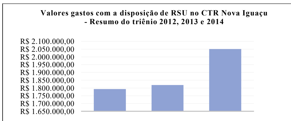
Figura 3: Gastos com a destinação final de RSU no CTR Nova Iguaçu.

Percebe-se um alto gasto com a destinação final de resíduos que em sua grande parte poderia gerar benefícios através da coleta seletiva, reciclagem e compostagem. A Figura 3 demonstra que o município de Mesquita teve um gasto de aproximadamente 5,5 milhões de reais com a destinação e tratamento dos resíduos sólidos urbanos gerados em seu território no período 2012-2014.