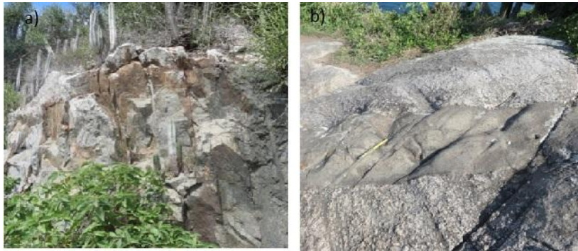
Figura 3 – a) Dique (Coordenadas S 22°59.818', W 42° 00.804'; elv: 206m). b) Rocha intemperizada. (Coordenadas S 22°58.790', W 42°01.755'; elv: 195 m).

Na intenção de desenvolver um conhecimento expressivo os alunos serão conduzidos ao local da atividade (Pontal do Atalaia), para o início da caminhada os alunos são orientados a utilizarem equipamentos de segurança para a coleta de resíduos e se dividirem em pequenos grupos de até 5 alunos, estando cada grupo com pelo menos um monitor (discente). Organizados dessa forma, os grupos iniciam a campanha de coleta de lixo espalhado pelo trajeto da trilha e a medida que forem percorrendo a trilha, alguns pontos de mais interessante da geologia serão mostrados. No percurso inicial da trilha o chão é composto com pedras de paralelepípedo e depois em chão “batido” (solo residual compactado mecanicamente), essa trilha dá acesso a uma das praias de Arraial do Cabo, o Pontal do Atalaia, e durante a caminhada os estudantes além de aprender a Geologia poderão contemplar as vistas deslumbrantes para a Praia dos Anjos e a Ilha do Farol. Espera-se fazer todo o percurso em 2 h.