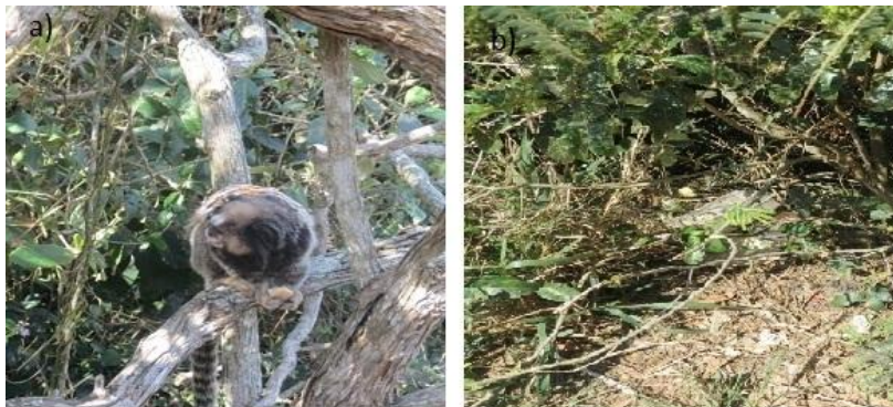
Figura 4 - a) Macaco Saguí alimentando se de biscoito.(Coordenadas S 22° 59.369', W 42° 00.892'; elv: 194 m). b) Lixo descartado por turistas próximo a praia (Coordenadas S 22° 59.632', W 42° 00.855'; elv: 168 m).

Após a trilha e com os materiais coletados, os alunos retornarão para a sala de aula onde então serão abertos os sacos dos lixos que serão colhidos na praia. Na sala pretende-se mostrar o impacto do resíduo sobre o solo e suas conseqüências sobre o meio ambiente. Vale ressaltar que durante o mapeamento da trilha para a atividade foram verificadas grandes quantidades de garrafa PET e latas de bebidas além de animais se alimentando do lixo deixado na área por turistas (Figura 4 b e a), o que já nos prediz o resultado esperado com os alunos da escola.