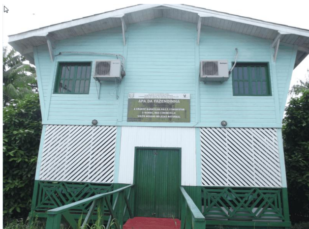
Figura 02 - Base Física (existente até meados de 2015)

A parte central da APA encontra-se ainda conservada, mantendo a mata e flora primitiva, apesar da existência de caminhos e pequenas passarelas para o trânsito dos que se utilizam da área. Como parte de sua infraestrutura, atualmente, a APA da Fazendinha dispunha de uma base física (Figura 02), porém a mesma foi incendiada em 2015, o que vem prejudicando, sobremaneira, o processo de gestão da unidade de conservação.