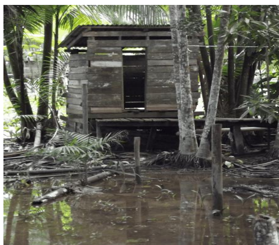
Figura 03 – Fossa negra utilizada pelos moradores

Outro dado preocupante quanto à saúde da população da UC e entorno é que 87% das residências usam uma espécie de latrina (popularmente conhecida como fossa negra), que despeja os dejetos humanos (fezes e urina) direto no solo ou na água dos mananciais, a exemplo do resíduo do esgoto, que, com o movimento das marés, os dejetos humanos acabam no rio e igarapés (Figura 03).