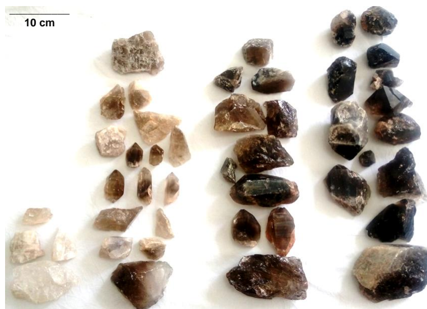
Figura 2: Amostras de quartzo coletadas de garimpos em Hematita, distrito de Antônio Dias – MG, com destaque para a variação de cores que vai do quartzo hialino ao fumê escuro, o que define a divisão em 4 grupos (HEM1, HEM2, HEM3 e HEM4, da esquerda para direita, respectivamente).

A classificação das cores dos cristais de quartzo foi realizada de forma macroscópica com o auxílio do Sistema de cores Munsell. Essa classificação é feita para determinar numericamente a cor dos minerais antes de qualquer tipo de tratamento que tem o intuito de modificar a sua respectiva cor do mineral (Tabela 1). Os grupos de quartzo encontrados em Hematita foram divididos em ordem crescente de intensidade de cor, ou seja, do cristal mais incolor para o fumê mais escuro. Vale ressaltar que o quartzo hialino (incolor) não recebeu nenhuma classificação no Sistema de cores de Munsell pelo fato desse mineral ser incolor e não possuir nenhum correspondente nesse sistema de cores.