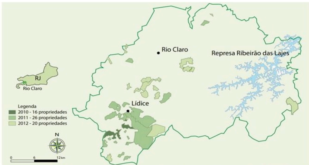
Figura 1: Área de implementação do Projeto Produtores de Água e Floresta.

Aplicando os critérios adotados, determinou-se que a área situada na porção mais a montante do sistema Guandu, região do Corredor de Biodiversidade Tinguá-Bocaina, seria a região foco do projeto. Em termos de microbacia, a do Rio das Pedras, em Lídice, distrito do município de Rio Claro, foi a escolhida. A área totaliza 5.227 hectares e compreende as principais nascentes do rio Pirai (Figura 1).