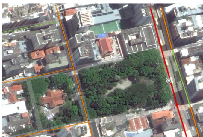
Figura 2: Fluxo de veículos na região do Parque Halfeld, Juiz de Fora, MG.