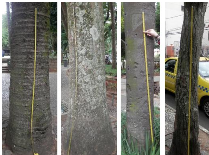
Figura 2- Amostra de troncos de árvores nas respectivas ruas, da esquerda para direita: Av. Barão do Rio Branco, Rua Halfeld, Rua Santo Antônio e Rua Marechal Deodoro.

Em todas as ruas foram observadas a presença de líquens, resultando nas tabelas 4, 5, 6 e 7, o que foi destacado neste estudo foi a diferença de ocorrência dos mesmos nos troncos presentes em cada extensão. A partir desse resultado, apresenta-se na Figura 5 um gráfico com a frequência dos níveis de concentração de líquens observados em cada extensão da área em estudo.